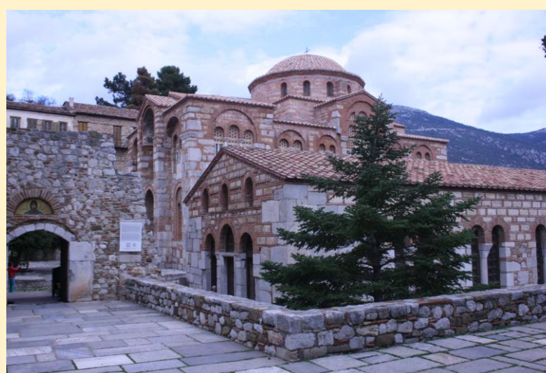
Η μονή Οσίου Λουκά