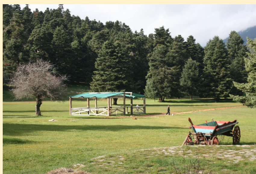
Το οροπέδιο Αρβανίτσας