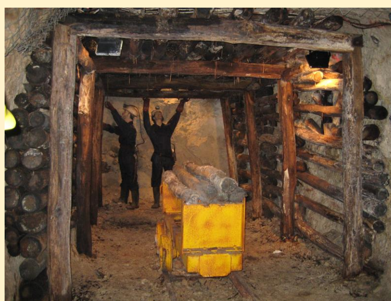
Μέσα στο ορυχείο «βεγονέτο»