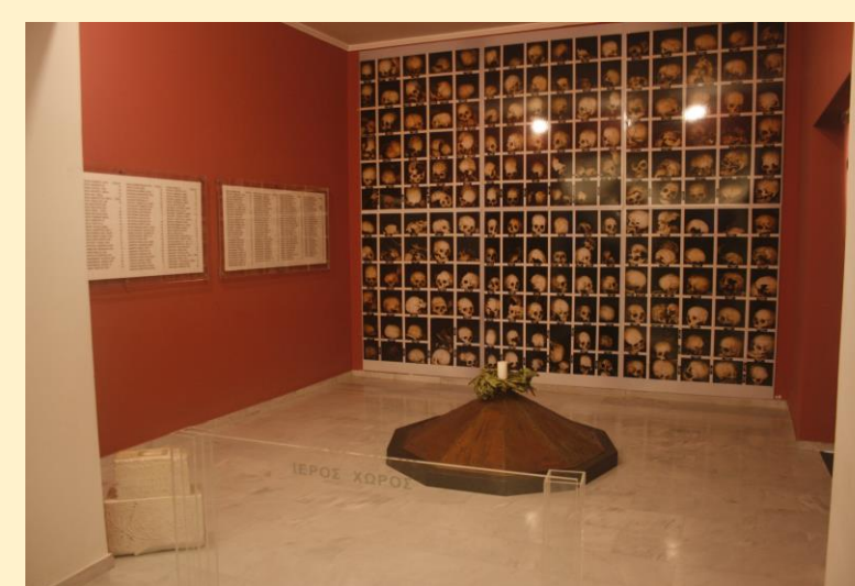
Το μουσείο Ναζισμού