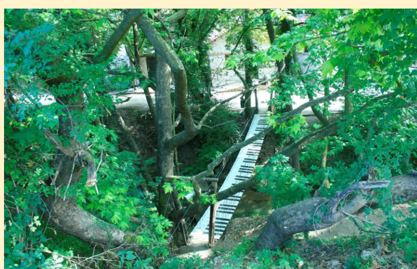
Το πάρκο δραστηριοτήτων στην Παύλιανη